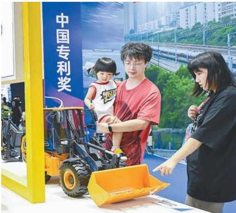
观众在博览会上参观铲车模型。

近年来,江苏认真贯彻落实习近平总书记关于知识产权工作的重要指示精神,在国家知识产权局的大力支持下,聚焦“走在前、做示范”目标定位,全面推进知识产权强省建设,以举办无锡设博会为契机,着力打造有国际影响力的知识产权展示、交流、合作平台,助力设计产业高质量发展。