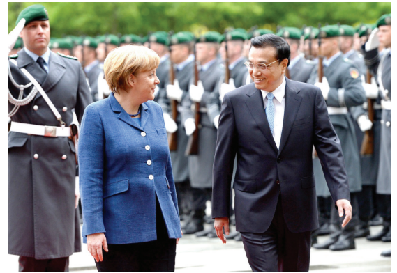
2013年5月26日,李克强同志在柏林出席德国总理默克尔举行的欢迎仪式。