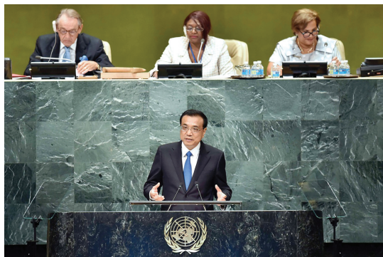
2016年9月21日,李克强同志在纽约联合国总部出席第71届联合国大会以“可持续发展目标:共同努力改造我们的世界”为主题的一般性辩论并发表题为《携手建设和平稳定可持续发展的世界》的讲话。