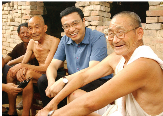
2003年8月8日,李克强同志在河南省新乡市调研。这是李克强同志在原阳县桥北乡马庄村与村民亲切交谈。