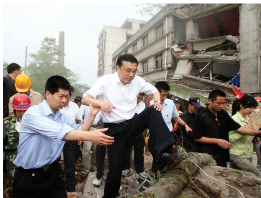
2008年5月19日,李克强同志在四川地震灾区察看灾情。