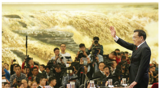
2016年3月16日,李克强同志在北京人民大会堂与中外记者见面,并回答记者提问。