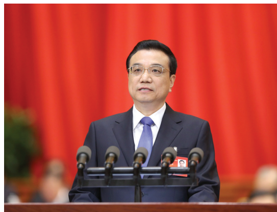
2014年3月5日,第十二届全国人民代表大会第二次会议在北京人民大会堂开幕。李克强同志作政府工作报告。