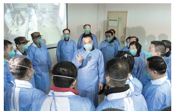
2020年1月27日,李克强同志赴湖北省武汉市考察指导疫情防控工作,代表党中央、国务院慰问疫情防控一线的工作人员。