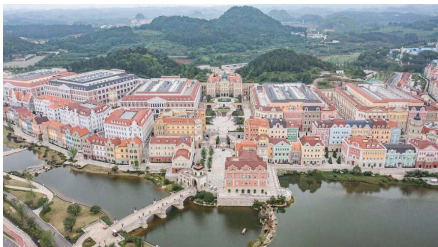
已投入运营的贵安华为云数据中心(2023年5月23日摄，无人机照片)。