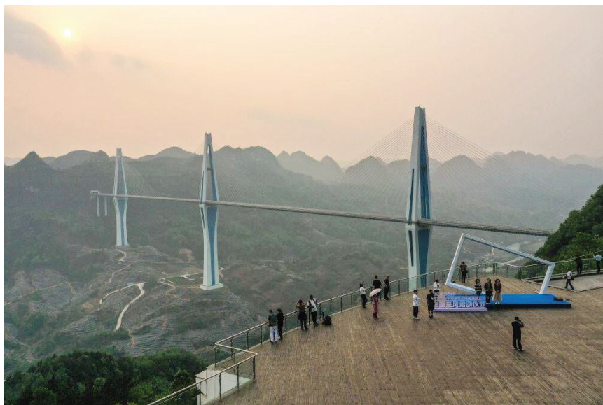
游客在贵州平罗高速公路“天空之桥”观光服务区观景台观赏平塘特大桥(2023年4月13日摄，无人机照片)。