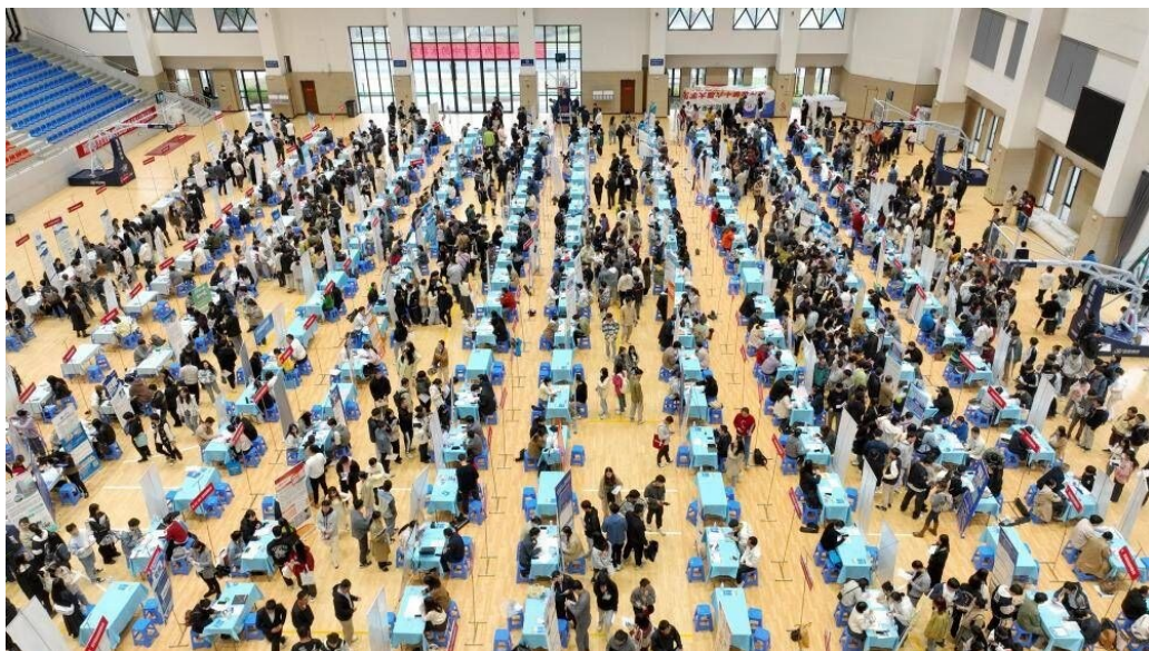
2023年11月10日,浙江德清,浙江工业大学莫干山校区举行校园专场招聘会。

记者11月21日从第二届全国人力资源服务业发展大会新闻发布会上获悉,2022年,我国共有人力资源服务机构6.3万家、实现营业收入2.5万亿元,较2019年分别增长59.1%、27.6%,较10年前分别增长2.2倍、4.4倍。