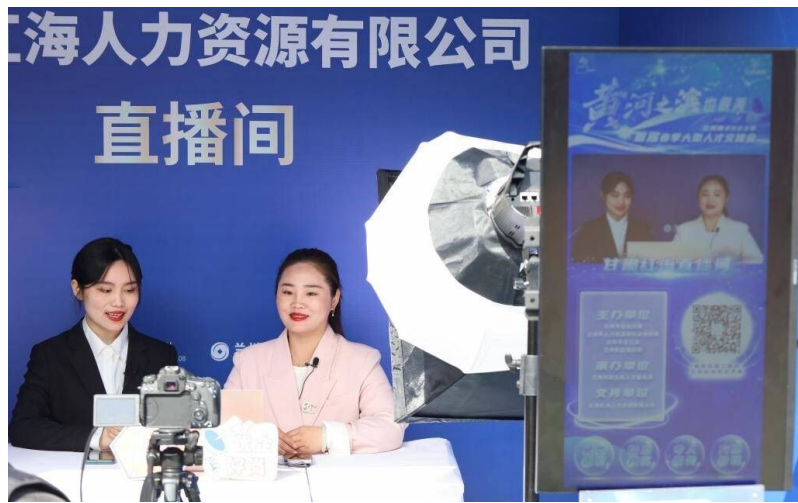
2023年4月8日,主播在兰州市春季人才交流会现场进行直播带岗。