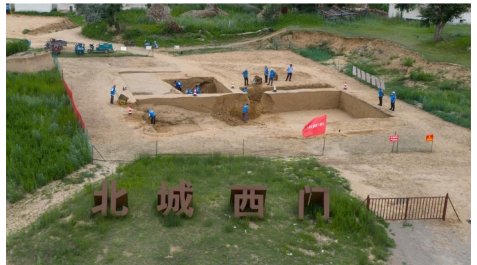
在内蒙古呼和浩特市和林格尔县,考古队工作人员对土城子古城遗址北城西门进行考古发掘(无人机照片)。