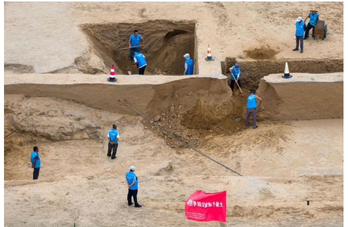
在内蒙古呼和浩特市和林格尔县拍摄的土城子遗址的古城墙剖面(无人机照片)。