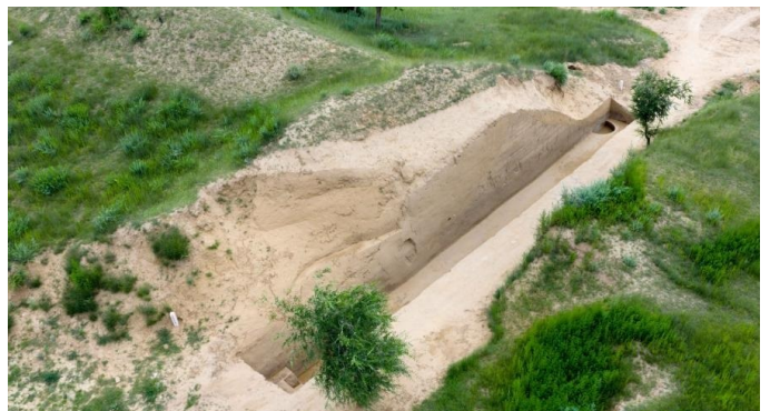
在内蒙古呼和浩特市和林格尔县,考古队工作人员对土城子古城遗址北城西门进行考古发掘(无人机照片)。