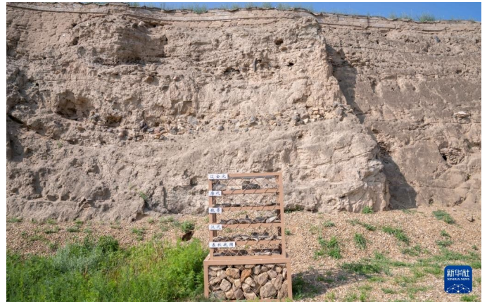
在内蒙古呼和浩特市和林格尔县拍摄的土城子古城遗址的底层剖面。